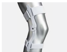
Renforts latéraux articulés