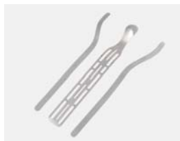
Baleine métacarpienne et renforts latéraux