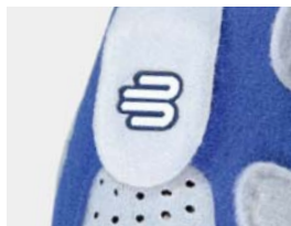
Bande velcro pour la mobilisation