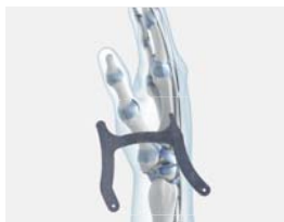
Renfort en aluminium