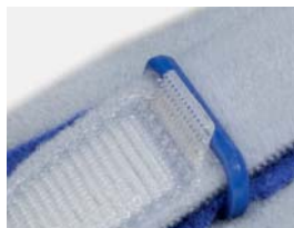
Fermeture « velcro » avec arrêt anti-retour