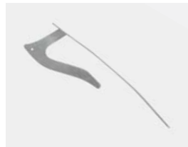
Renfort en aluminium