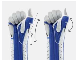
Fixation du pouce réglable de manière individuelle