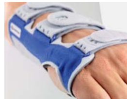
Finition des bords avec technique de soudure par ultrasons