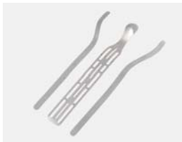
Baleine métacarpienne et renforts latéraux