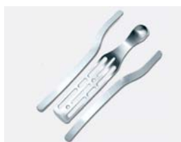
Baleine métacarpienne et renforts latéraux