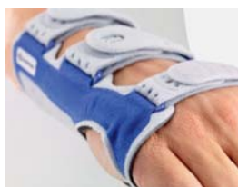
Finition des bords avec technique de soudure par ultrasons