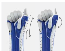
Fixation du pouce réglable de manière individuelle